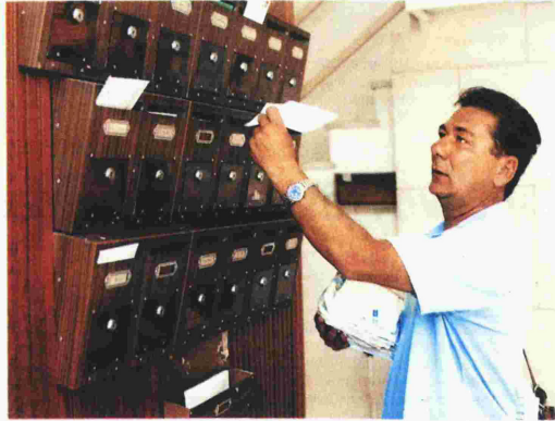
Οι ειδικότητες που θα προκηρυχθούν είναι διανομείς, υπάλληλοι εσωτερικής εκμετάλλευσης, οδηγοί και διαμετακομιστές

Αναφορικά με τις ειδικότητες που θα προκηρυχθούν, αντιστοίχως σε αποφοίτους Γυμνασίου και Λυκείου και είναι οι ΔΕ Διανομέων, Εσωτερικής Εκμετάλλευσης και Οδηγών και η ΥΕ Διαμετακομιστών. Τα προσόντα που πρέπει να διαθέτουν οι υποψήφιοι είναι τα ακόλουθα: