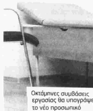
Οκτάμηνες συμβάσεις εργασίας θα υπογράψει το νέο προσωπικό

χρόνου ανεργίας σε ποσοστό 40% και η εμπειρία σε ποσοστό 60%. Τα απαραίτητα δικαιολογητικά είναι: φωτοαντίγραφο της αστυνομικής ταυτότητας, φωτοαντίγραφο του τίτλου σπουδών, βεβαίωση ανεργίας από τον ΟΑΕΔ, αποδεικτικό εμπειρίας και άδεια άσκησης επαγγέλματος, όπου απαιτείται. Υποβολή αιτήσεων και δικαιολογητικών έως 27/5 στο Κέντρο Προστασίας του Παιδιού, Τέρμα Ιοκάστης, Τ.Κ. 65110. Τηλέφωνο: 25135 00500.